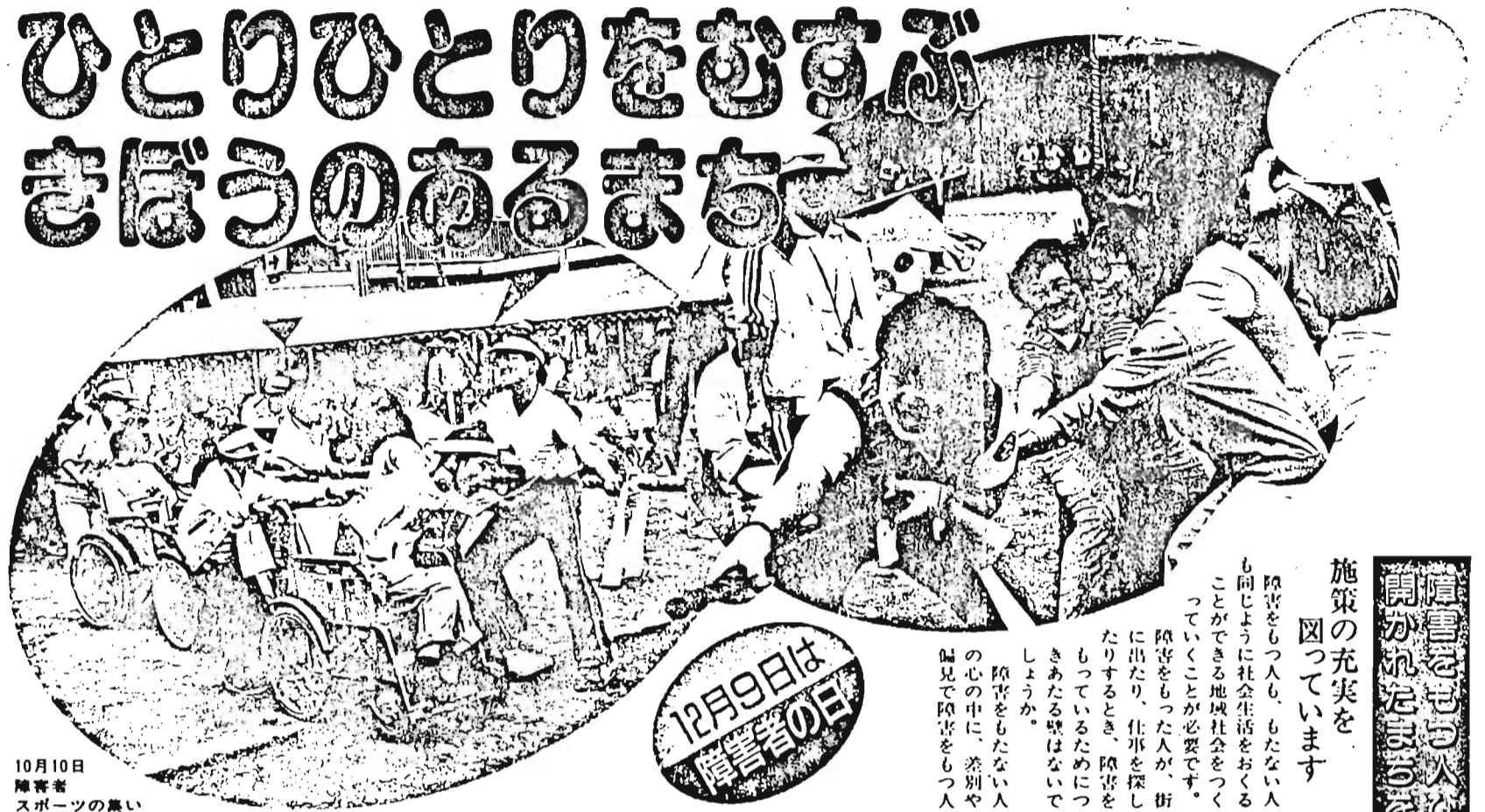
10月10日 障害者 スポーツの盛り