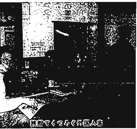
旅館でくつろぐ外国人客

海外で日本人だということだけで辛い目にあつたこと、逆のことを、日本でもあり得る。逆のことを、日本でもあり得る。逆のことを、日本でもあり得る。逆のことを、日本でもあり得る。