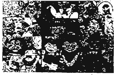
第24回共同作品「ビックリマン」

心身に障害をもつ子どもたちが、1年間学習してきたものをお互いに発表・展示して、1人でも多くの人と喜びを分かちあひ、成長をたしかめ、次の学年への反省としていく総決算の場が「まごめ展」です。 現在区内には、心身障害者学芸会とちえおくれ学級（小学校5校・中学校4校）、情緒障害学級（小学校1校）、ことばときこえの教室（小学校1校）の11校があります。どの学校でも子どもたちは喜び、がんばり、そして目を輝かせて生きています。そんな活動のありのままを11校が合同で発表・展示します。 （作品展示）①2月25日（土）午