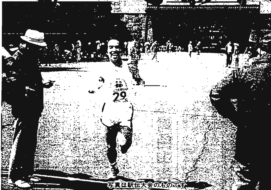
写真は駅伝大会のもの