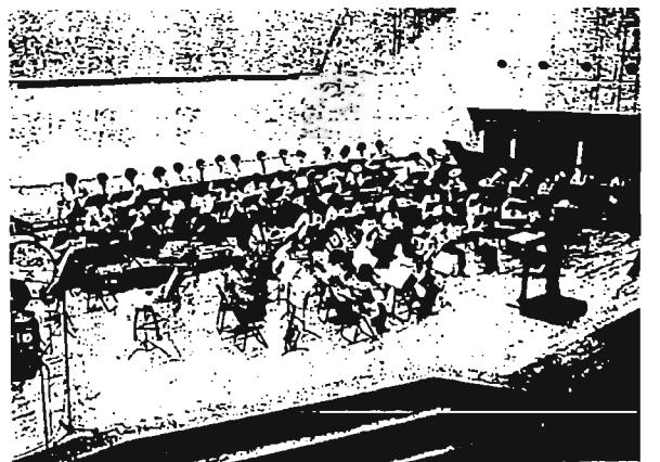
豊島区吹奏楽団演奏会

ですが、本区としては、地元演劇界が発案したこの演劇祭が、更に発展し東京を代表する国際的イベントとして定着できますよう支援していきたいと考えます。また、12月18日から8日間、同劇場をメイン会場として、「豊島区民芸術祭」を開催します。そして、池袋西口公園は東京芸術劇場の前庭と一体的に整備し、「平和の像」を新設した公園の一角に建立します。