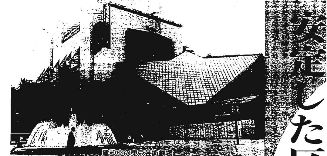
建設中の東京芸術劇場

7月2日です 納期は この住民税は、平成元年度の所得に課税されるもので、会社などを退職し、現在無職の方でも前年所得のある場合は課税されます。 会社などに勤務し、住民税を特別徴収されている方は、毎年6月分の給料を第1回として、翌年の5月分の給料まで12回に分けて納めていただいています。が、途中退職された方は、給料が 平成2年度の主な改正点は左表のとおりです。 そのほか、土地建物等の譲渡益に係る課税の特別措置についても改正されました。 詳細: 区民税第一・第二係 内線2314・2321 普通徴収分の特別区民税・都民税を第1期の納期内に第1期納金がつきます 一度の手続きで、納め忘れや納期のために区役所や金融機関へお出かけになる手間がはげます。手続は、6月20日(木)までに、平成2年度の特別区民税・都民税納付書(普通徴収分)と預金通帳および印鑑をお持ちになり、利用されている金融機関へ「預金口座振替依頼書」を提出してください。 納税通知書が届きましたら、納期前までに指定の預金口座の残高の確認をお願いします。残高が不足ですと引き落としができません。特に全納希望の方は報奨金がかなくなり、納税通知書をお送りします。 注意: 納税通知書が届きましたら、納期前までに指定の預金口座の残高の確認をお願いします。残高が不足ですと引き落としができません。特に全納希望の方は報奨金がかなくなり、納税通知書をお送りします。 2期・3期・4期分をまとめて「全期分納付書」で納めていただきますと、報奨金が交付されます。式のとおり、ただし、第4期分の税額25万円を上限とし、25万円を超える部分については計算されません。つまり、報奨金の最高限度額は2万5千円となります。 第4期税額 100 × 10ヵ月 = 報奨金額