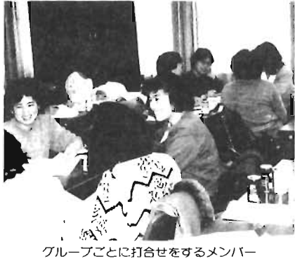
グループごとに打合せをするメンバー

区内の区立小学校の各PTA会長から推せんされた29名の方たちが、1年間区から委嘱され活動している。 4月から毎月1回定例会に出席し、研修会、ビデオ上映「人権宣言」、「故郷の空」(同人権宣言)、「故郷の空」(同人権宣言)。 係者やOBを除いてはあまり知られていない。「自分たちの身近な問題として、もっとたくさんのお母さん達に関心をもってもらいたい」とメンバーの方たち。「日頃、他校との母親同志の交流はほとんどないので、情報交換もできるし、視野を広げることもでき楽しかった」と。中には全員が仕事を休んでいるグループも。「仕事の都合で全員が出席できず、連絡を取り合いながら、分担、協力してレポートをまとめました」。 3月4日(日)には、勤労福祉会館でそれぞれのグループがテーマ別に研究発表を行う予定。1年間の活動を終えた後は、OB会や学習グループなどと共に家庭教育に関する地域のリーダーとして活躍する。 なお、発表会の内容等については、次ページの催し欄に掲載しています。