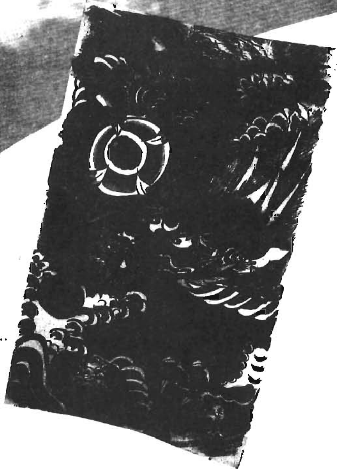
玉宝をつかむ龍 縦180cm×横100cm 昭和57年作