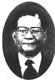
豊島区長 加藤一敏