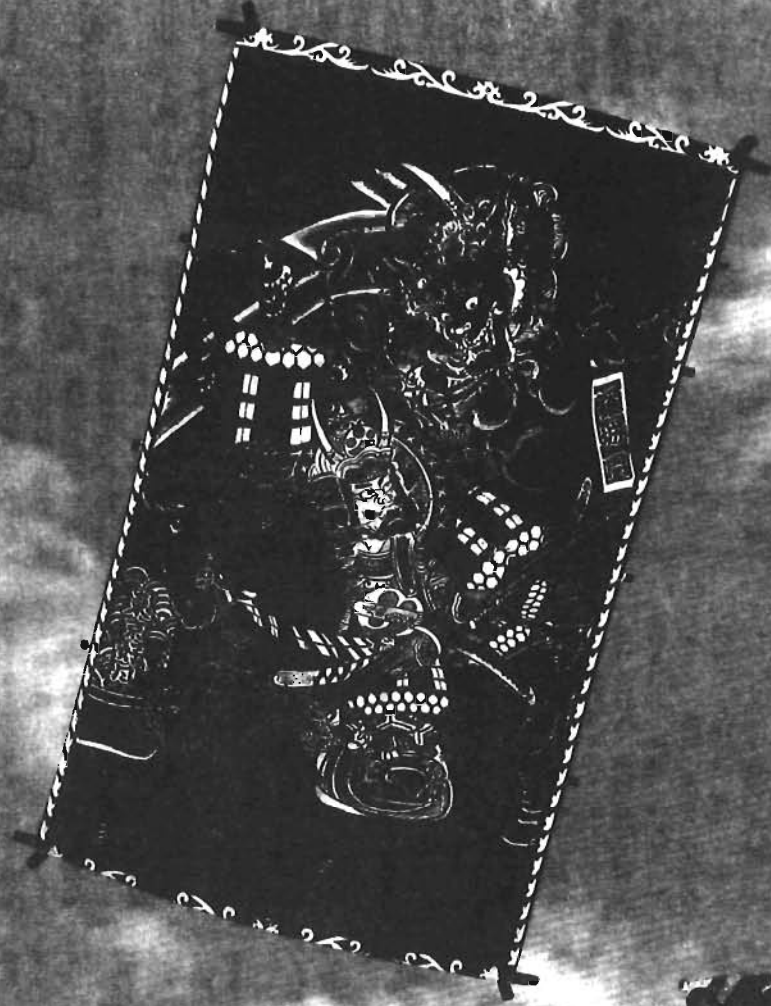
羅生門の鬼を退治する 渡辺綱 縦160cm×横85cm 昭和52年作