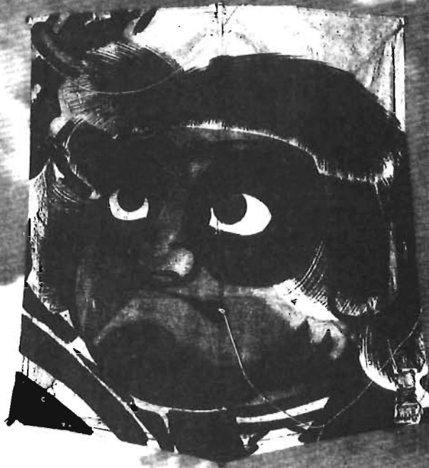
金太郎 高さ50cm×幅40cm 昭和52年作