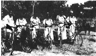
地元保健婦などの足として活躍する再生自転車(タンザニア)

「国際協力」というと、国や国際機関が中心になって行われてきたが、最近では、地方自治体の国際協力が盛んになり、質的にも拡大しています。これは、地方自治体が長年培ってきた、地域住民に対する豊富な経験と人材によって、国レベルでは実施しにくい、きめ細かな国際協力が可能だからです。こうした、草の根の国際協力には、豊島区も一役買っています。次のように再生自転車の開発を、上国に譲っています。