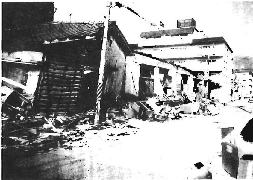
神戸市内で(1月26日撮影)

1月17日早朝、阪神地域を襲った兵庫県南部地震は、大都市直下型地震の恐ろしさを私たちにまざまざと見せつけました。被災された皆さんには心からお見舞いを申し上げます。 現在、区では、今回の大震災を踏まえて災害対策の見直しをすすめています。区民の皆さんから防災に関する問い合わせが数多く寄せられていますので、区の災害対策の現況をお知らせします。 各家庭での備えや避難場所などについては、2月26日(日)に「広報ししま防災特集号」を発行する予定です。ご覧ください。 ◆詳細：防災課内線2371、4