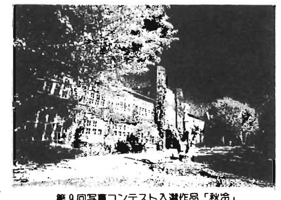
第9回写真コンテスト入選作品「秋冷」

応募点数は3点以内◇応募ジャンル：次のジャンルから選んで応募票に記入してください①緑と自然②風景・風物③人・人たち④祭り・イベント⑤名所・モニュメント⑥その他(①~⑤以外の作品)◇サイズ等：六つ切り、写真真◇入賞作品：優秀な作品、新しい発見には区長賞、観光協会会長賞など多数用意しています◇応募先：生活産業課または豊島区写真材料商業協同組合加盟写真店◇応募方法：所定の応募票に記入して提出また が急増しています。 警視庁では、死亡者数を30人台までに減らす運動として「'96チャレンジ300作戦」を実施しています。 本年10月末現在の交通事故による死亡者数は312人で、その特徴として年齢別では、高齢者が最も多く、次いで若年層となっています。時間別では、夜間に約6割発生しており、特に午前0時~2時の間が多くなっています。違反別では、歩行者では信号無視が最も多く、車両では安全不確認が最も多くなっています。 交通事故の防止は自らの問題として、自覚と責任を持って区民一人ひとりが交通ルールと交通マナーを身につけ、悲惨な交通事故のない明るい家庭を築いていきましょう。 ◇詳細：各警察署交通課へ