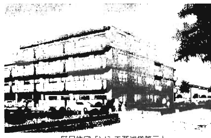
区民住宅「ソシエ西池袋第三」

この募集は、区民住宅「ソシエ西池袋第三」(新築)入居者およびあき家入居者、高齢者向け住宅「つじ苑」あき家入居者を決定するためのものです。 あき家入居者には、あき家が誕生したとき、登録順に住宅のあき家をします。 区民住宅「ソシエ西池袋第三」19戸、あき家入居登録者8名の募集 ◎申込資格：次のすべてに該当する方が区内に引き続き1年以上住所を有している者 3人以上の世帯構成で、かつ義務教育終了前の児童、または乳幼児が1人いる者自ら居住するための住宅を必要としていて、その世帯の平成8年の月額所得が20万円以上60万円以下である。申込みしおり配布：5月16日(23日まで)区役所各出張所で配布(土、日を除く)◎申込み：所定の申請書に必要事項を記入し、5月23日(消印有効)までに郵送 高齢者向け住宅「つじ苑」あき家入居登録者単身用3名、世帯用2名の募集 ◎申込資格：次のすべてに該当する方が単身用は65歳以上でひとり暮らしをしている 「公営住宅に優先的に入居できる」と語り、手数料等を請求する申込代行業者がいま、すが、区は全く関係ありません。優先的に入居できるといううそはありませんで、ご注意ください。