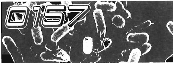
O157の顕微鏡写真