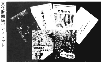
文化財関係パンフレット