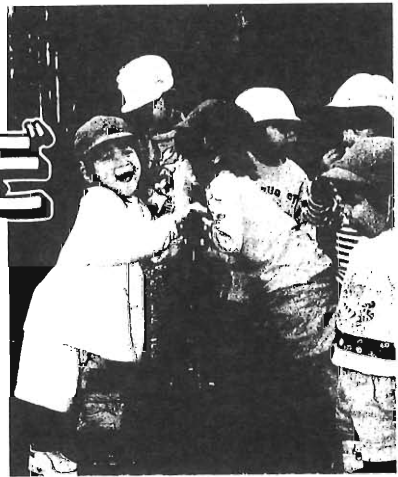
平成10年4月入園可能予定数