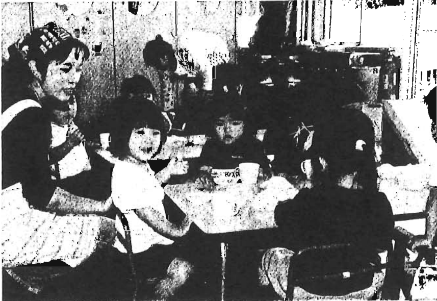
保育園の給食(千早第一保育園)