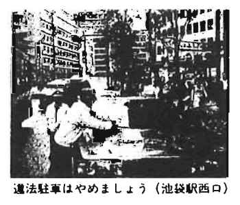
違法駐車はやめましょう(池袋駅西口)

12月は、毎年交通事故が多く発生する時期です。特に年末は、年間を通じて最も交通渋滞が激しくなります。目的の地に早くあがり、交差点や道路を無理に横断したり、シートベルトを着用しないドライバーが増加する等、交通ルールが軽視されがちです。そこで、今月の11～20日までの10日間、地域から悲惨な交通事故をなくすため「年末交通安全キャンペーン」を、二つの重点項目を掲げて実施します。 ①高齢者や若者の交通事故防止 本年9月までの都内の交通事故による死者数24人のうち、高齢者(65歳以上)の死者数は67人で全体の約27%を占めています。そのうち、46人(約69%)の方が歩行中に事故に遭って亡くなっています。 歩行者は道路を横断する際に、