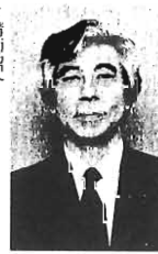
講師紹介：昭和12年生野興生まれ。東京外国語大学英米科卒業後、NHKに入社。現在はフリーランスとして活動中。

平成11年度特別区民税・都民税の納税通知書(普通徴収分)を6月10日に発送します 住民税(特別区民税都民税)は、前年(平成10年)の所得に対して課税されます。会社を退職したなどにより、現在無職の方でも10年中に所得があった場合には本年度の住民税を納めていただくことになります。