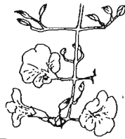
つるの先に下がった花房

丈夫で育てやすいので、夏の庭木に適したつる性樹木です。区内では、谷端川南緑道や、向原近くの都電沿線で見ることができま