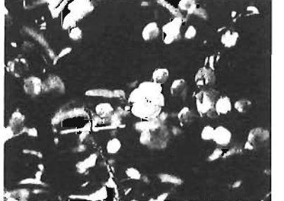
ハナカイドウ(南長崎1丁目仮児童遊園)