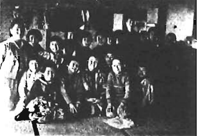
疎開先の子どもたち

①～③とも午後2～4時 勤労福祉会館◇50名※全回参加できる方を優先。先着順◇申込み・詳細…当館☎3980-2351