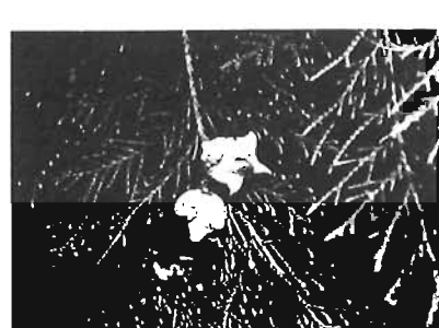
コノテガシワ(千早フラワー公園)

プール・トレーニングルーム 11月26日(月)～12月1日(土)◇水の入替え、機器点検・整備、清掃等のため※武道場は通常どおり利用可。◇詳細…当センター☎5974-7262