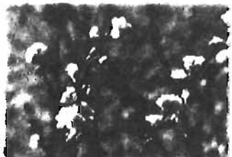
学名 Prunus x subhirtella cv. Autumnalis 分類 バラ科サクラ属

11月下旬ごろから、上池袋さくら公園、上池袋三丁目第3児童遊園で咲き始めます。コヒガンザクラの園芸品種で、旧暦の10月に咲くのでこの名前がつけましたが、4月上旬にも咲きます。八重咲きで春よりも小型です。花色は白色、淡紅色が多く、濃紅色もあります。