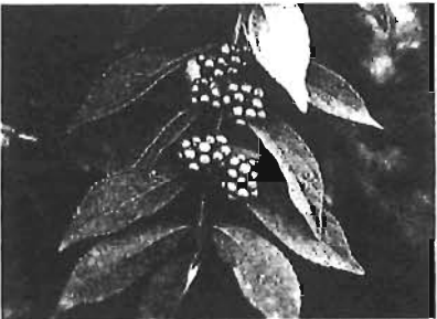
ムラサキシキブ(千早緑地公園)

11月21日(水) 午後7～9時 豊島ボランティアセンター◇活動の種類や選び方、ボランティア保険など◇10名 ◇申込み・詳細…当センターへ☎3984-9375