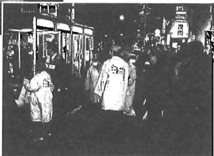
風俗チラシも除去します

安全で明るく暮らしやすい豊島区をつくるために豊島区生活安全条例を制定（平成12年11月）し、一年が経過しました。この間、区では地域の方々と協力して、様々な取組を行ってきました。