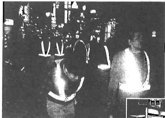
夜間の環境浄化パトロール