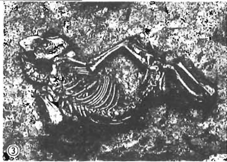
①千登世橋中学校用地の地層のはぎ取り作業 ②営団13号線建設用地内で発見された江戸時代の地下室 ③武家屋敷の中で発見された、犬の骨格

現在、区内には16か所の遺跡（これを「周知の埋蔵文化財包蔵地」といいます）が確認されています。これらの遺跡からは今までに旧石器・縄文・弥生・古墳時代の遺物や集落跡、江戸時代の大名屋敷や町家・植木屋・料理屋などに関する様々な遺構・遺物が発見されています。