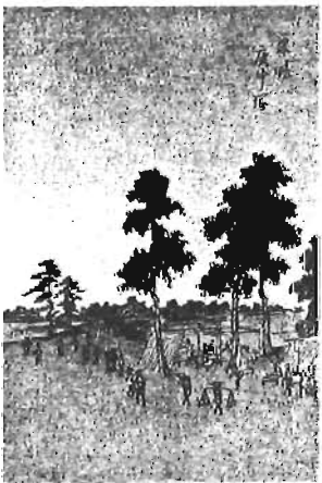
【絵本江戸土産】より

歌川広重の描く街道沿いの風景に、幕末の集積地申塚あたりのものがあります。左の図は現在のとげぬき地蔵通りと折戸通りの交差点付近を描いたものです。ここは立場(休憩所)であったので、茶屋で一休みする旅人の姿が見えます。中央の道が中山道で板橋宿に続いています。右手の道が王子道で、大木の下に道標が建っています。天保7(1836)年に刊行された「江戸名所図会」(長谷川雪旦画)に同じ道標が描かれており、そこには「王子稲荷大明神 右わうし(王子)道」と刻まれています。王子稲荷神社や王子神社の参拝客はもちろん、春には飛鳥山の桜、秋には金剛寺の紅葉を楽しむ人々で、王子道はさぞかし賑わったことでしょう。