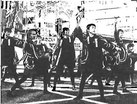
東京よさこい (平成13年)

区民団体等主催の区制施行70周年記念事業を支援します。70周年を記念して、新たな企画による文化・芸術・国際交流等、これからの区の文化振興、発展に大きな効果が期待できる事業に対し、審査会の審査により事業経費の一部を補助します。 ◇申込み・詳細…文化芸術施策調整係 ☎3981-1270