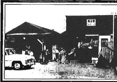
駒込駅(昭和20年代初期)