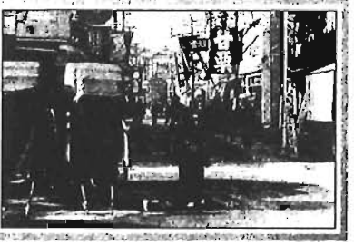
池袋西口(昭和初期)