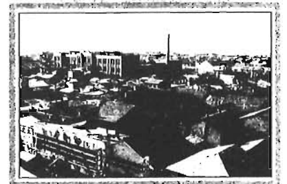
池袋駅西口(昭和35年ごろ)