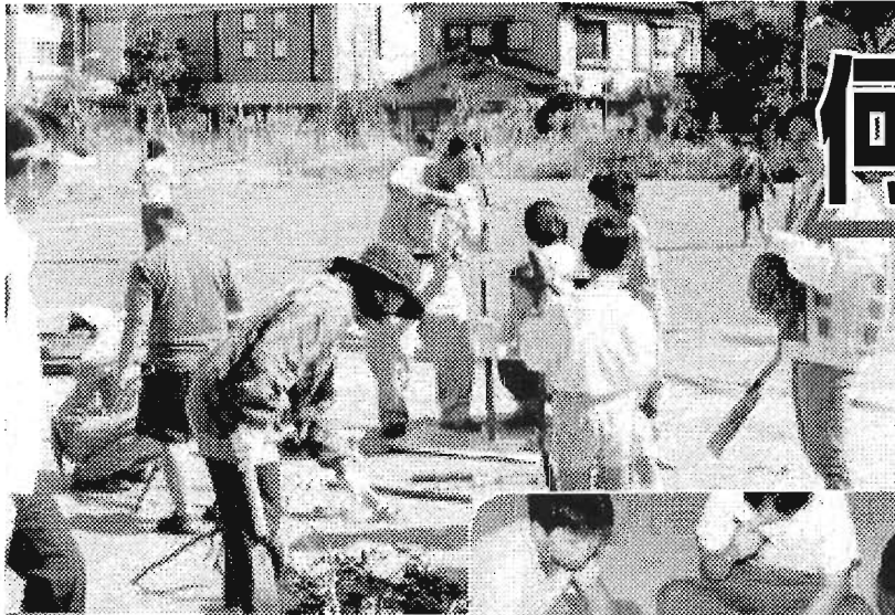
一日体験プレパーク▲

6月20日(金) 午後1時30分～4時 池袋西口公園 ◇詳細…水道局豊島営業所 ☎3983-3241