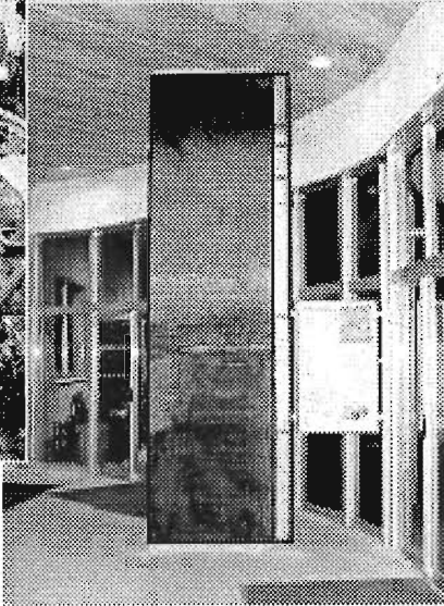
▶地層はぎ取りパネルの展示

現在、区内には16か所の遺跡(「周知の埋蔵文化財包蔵地」といいます)が確認されています。これらの遺跡からは旧石器・縄文・弥生時代の遺物や集落跡、江戸時代の大名屋敷や町家・植木屋・料理屋などに関する様々な遺構・遺物が発見されています。 その中から最近の発掘調査の成果を紹介します。 ◇詳細…文化財係☎3981-1190