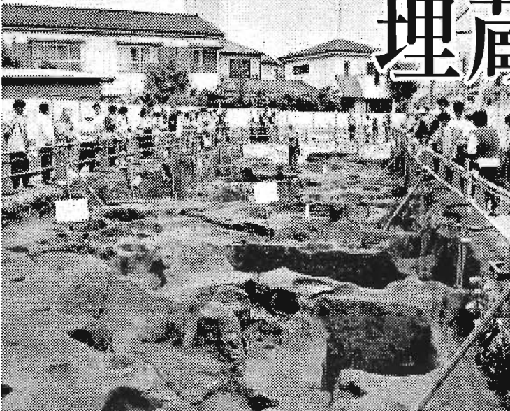
▲雑司が谷遺跡見学会