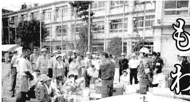
救援センターでの 防災訓練

1月18日 午前10時～午後4時 区役所本庁舎1階 ◇取扱業務…住民票、国民健康保険等 ◇詳細…日曜窓口代表☎3981-1358