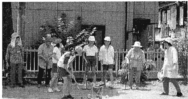
高南小児童とゲートボール交流 (高田ことぶきの家)