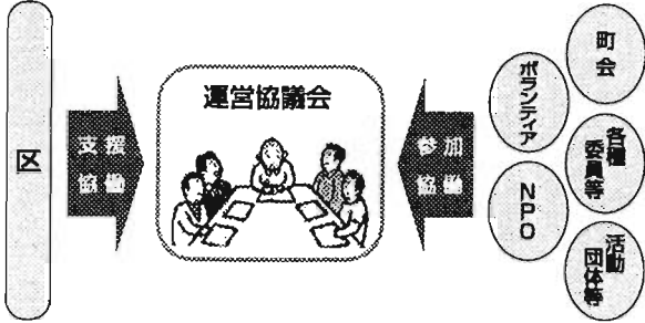
地域区民ひろば「運営協議会」のイメージ

答 将来的には地域ごとに運営協議会を設置し、区民の皆さんの自主的な運営に委ねていきたいと考えています。当面は職員を配置して区が直接運営します。