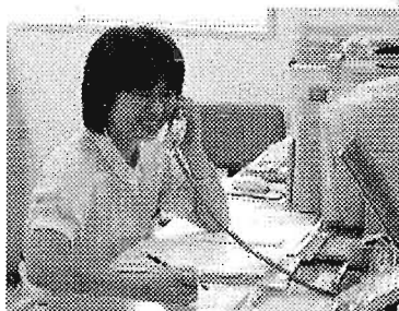
▲電話相談 雑司が谷在宅介護支援センター

相談 一人暮らしの母が、最近食事の支度が負担になってきているようです。腰が痛くて買物も行けないようです。食事がきちんと取れないので心配です。対応 まず訪問をし、実際にご本人がどのような生活をされているのか伺いました。その後、介護保険サービスについての説明や配食サービスなど、ふさわしいサービスを紹介し、利用されることになりました。