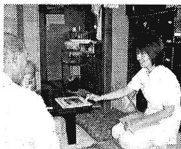
▲訪問相談 西池袋在宅介護センター

自宅を訪問して日ごろの生活で難しくなってきた動作や生活の様子を伺い、身体虚弱や転倒の危険性など老化のサインをチェックします。一人ひとりが元気で生き生きとした生活が過ごせるよう、筋力向上トレーニングや失禁予防教室などを組み入れその人に合った「お達者プラン」を作成します。