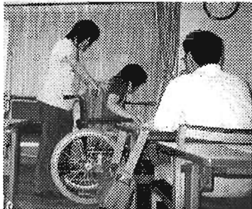
▲いけよんの郷在宅介護センター