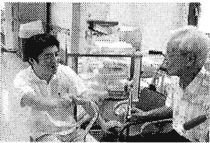
▲福祉用具相談 山吹の里在宅介護支援センター

各種福祉制度のご紹介、介護に関する悩みの相談、保健福祉介護サービスの案内や助言をします。