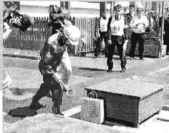
4月 大規模都市災害合同訓練