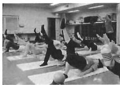
▲金メダルボディは食事と運動で