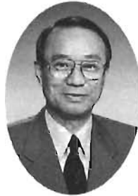
豊島区長 高野 之夫