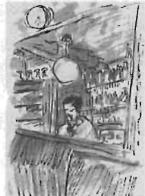
▲「カフェ(3)」水彩・インク・紙