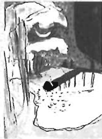
▲「月夜の暮明」水彩・インク・紙