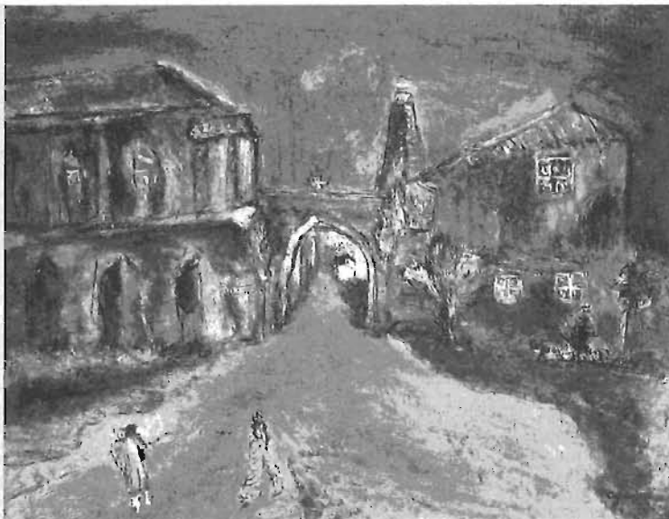
▲「夕陽の立教大学」油彩・カンヴァス