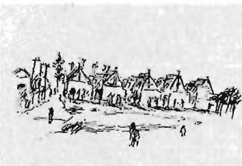
▲「長崎アトリエ村」インク・紙