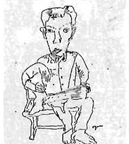
◀「寺田政明像(2)」インク・紙