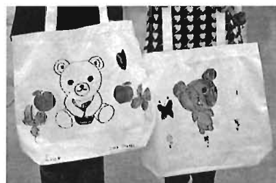
自分だけのマイバッグを作ろう(体験教室)

ほか ※各イベントの詳細は、2月28日発行の「広報としま特集号」をご覧ください。