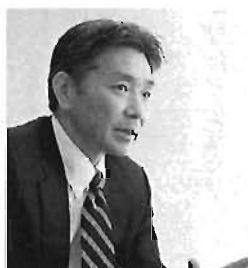
ビジネス交流会の講師