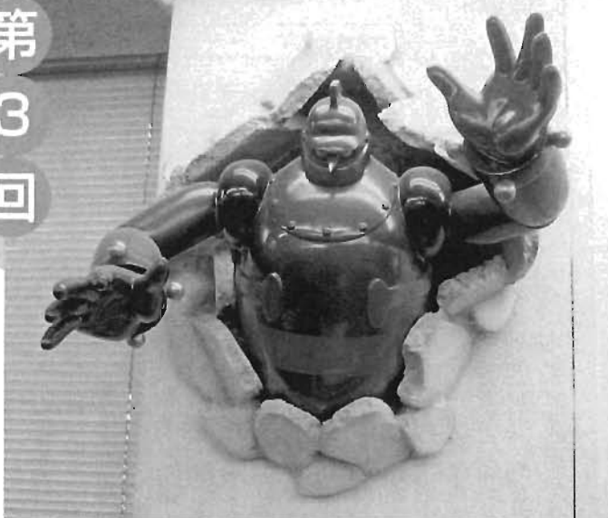
特別展には千早図書館から「鉄人28号」も来るよ