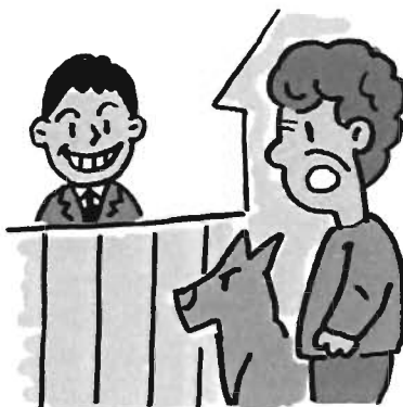
見知らぬ人の出入りが気になる