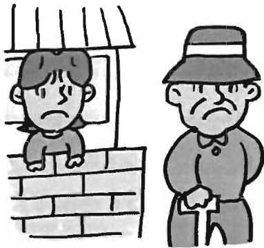
いつも姿を見かけるのに見かけなくなった