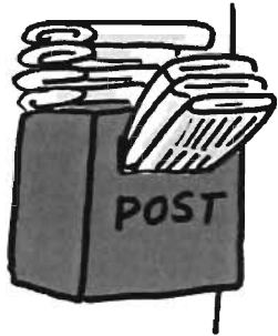
新聞がポストにたまっている