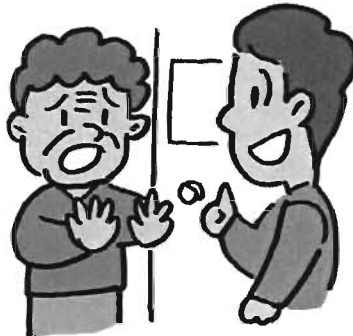
訪問時に、家族が「本人は元気」と言って、会わせようとしない