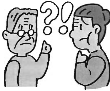
同じことを何度も言ったり、聞いてきたりする。