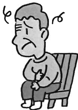
具合が悪そうなのに受診していない