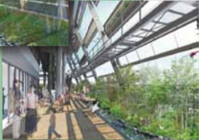
グリーンテラスのイメージ