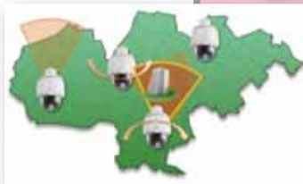
▼防災カメラ配置イメージ