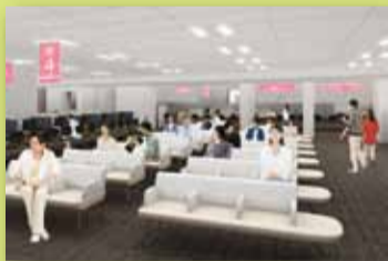
▲3階総合窓口のイメージ