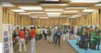
災害時の利用イメージ▶