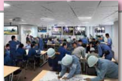
▲5階災害対策本部のイメージ