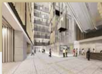
1階アトリウムのイメージ▶