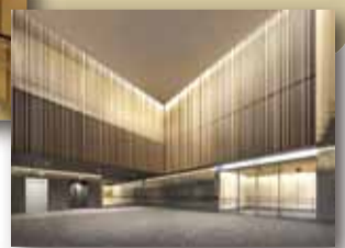
▼地下通路につながるロビーのイメージ