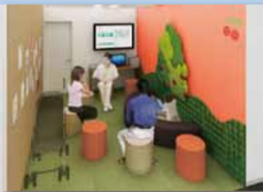
子育てインフォメーションのイメージ