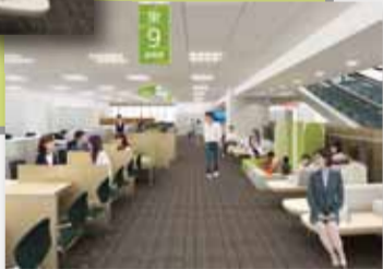
▼4階福祉総合フロアのイメージ