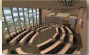
会議使用時のイメージ▶