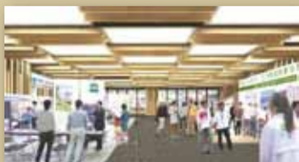
▲企画展開催時のイメージ