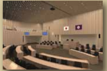
▲議会開催中のイメージ