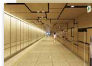
▲地下通路のイメージ