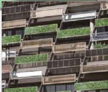
▲エコヴェールの外観イメージ