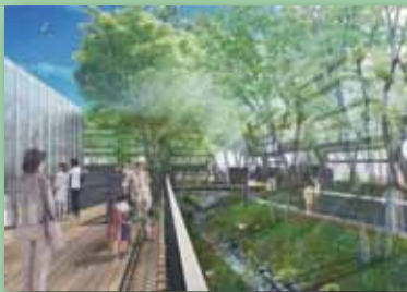
豊島の森のイメージ