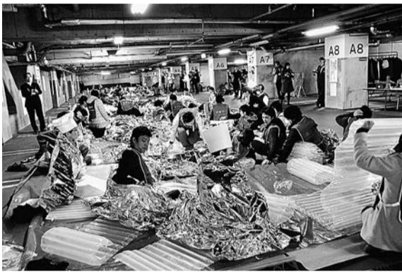
▲一時滞在施設での訓練

池袋駅周辺で、大地震の発生を想定した帰宅困難者対策訓練を実施します。 帰宅困難者役として実際に池袋駅周辺にとどまり、震災時の行動ルールを実践してみませんか。事業所、団体、個人は問いません。