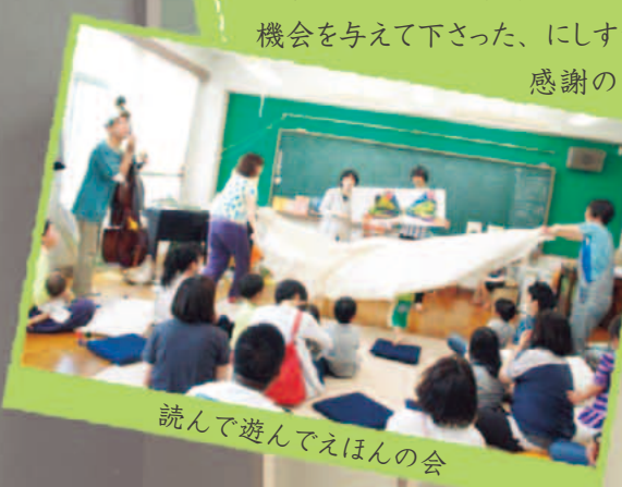
読んで遊んでえぼんの会

約10年、創造舎でたくさんの絵本を読み、たくさんの人たちとお話をしました。私どもも、子育てをする立場となり、このように子どもを連れて来られる場所は他にないと実感しています。機会を与えて下さった、にしすがも創造舎の皆さんに感謝の気持ちでいっぱいです。また会いましょう！