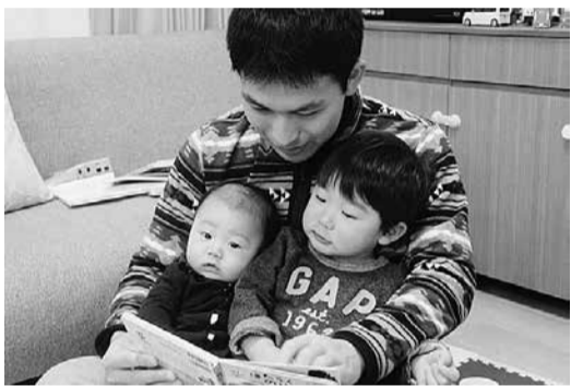
▲平成27年度イクメン・カジダン・イクジョイ写真展 最優秀賞ほくたちの特等席