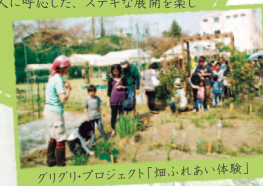
グリグリ・プロジェクト「畑ふれあい体験」

2005年夏の「五感ミュージアム」にはじまり、『グリグリ・プロジェクト』の監修、ワークショップなど、これまでいろいろな形で関わらせていただき、ただ単に、アーティストとしての経験を積むことができただけでなく、場所といろんな世代の人とのつながりの深さ、大切さを教わりました。これからも、その場所、人に呼応した、ステキな展開を楽しみにしています！