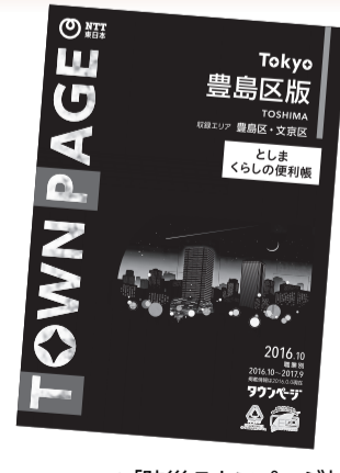
▲「防災タウンページ」とセットで配布します

平成28年度「としまくらしの便利帳」(旧称:豊島区くらしのガイド)を掲載したタウンページを、区内全域の世帯・事業所に配布します。「としまくらしの便利帳」は、生活に役立つ行政情報を案内しています。ぜひ利用してください。 ◇ 配布期間 …9月上旬～30日※地域により配布日が異なります。 ◇ 発行 …NTT 東日本、 編集 …NTTタウンページ(株) ☎広報グループ☎4566-2532