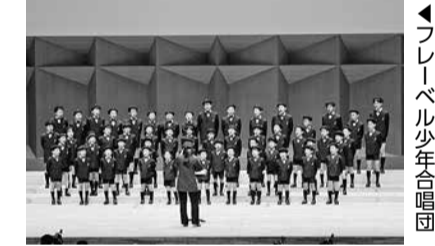
▲フレール少年合唱団