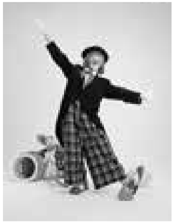
▲クラウンTogaさんのパントマイムやバルーンアートもお楽しみに！

12月2日(金) 午前10時30分～午後0時30分 としまセンタースクエア(区役所本庁舎1階) ◇ピエロによるバルーンアート、フルート・ギターの演奏と歌、保育士による手遊び、大型ペーパーサートなど、親子で楽しめるイベントが盛りだくさんです。一緒に楽しい時間を過ごしましょう。 当日直接会場へ。 豊島池袋第一保育園 ☎3987-4621