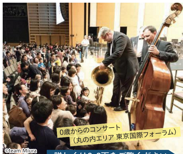
0歳からのコンサート (丸の内エリア 東京国際フォーラム)