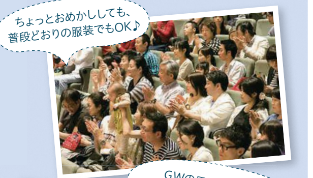
ちょっとおめかししても、普段どおりの服装でもOK!

4月23~27日 各日正午から ※26・27日は午前10時50分からも開演。 ヴァイオリン、ピアノ、歌、トランペットなど毎日異なる編成でコンサートを行ないます。