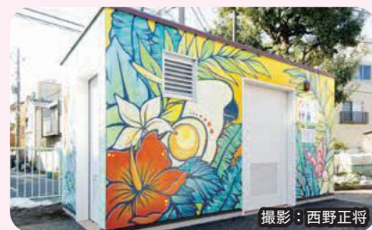
▲アートトイレ第1号の池袋公園

地域に点在する公園を新たな地域コミュニティの場として活用するプロジェクトがスタートします。また、公園などのトイレを順次改修するとともに、地域で活躍する若手デザイナーを起用し、トイレアートを展開していきます。