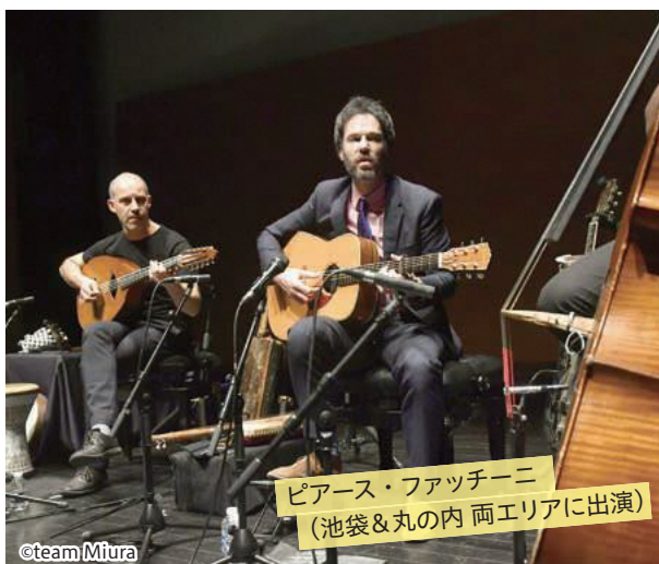
ピアース・ファッチーニ (池袋&丸の内 両エリアに出演)