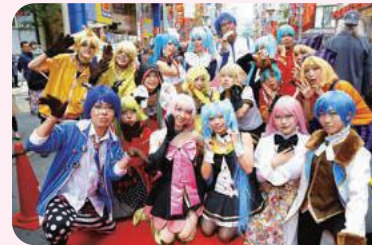
▲提供:池袋ハロウィンコスプレフェス2017/niconico

日中韓の各国から文化芸術による発展を目指す都市を毎年1都市選定し、様々な文化イベントを展開する「東アジア文化都市」の2019年国内都市に決定しました。「マンガ・アニメ」「舞台芸術」「祭事・芸能」を柱とした事業を展開します。平成30年度は基本計画の発表、ロゴ作成やイベント開催などにより、年明けのオープニングへとつなげます。