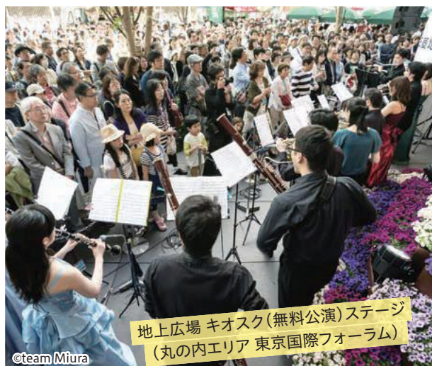
地上広場 キオスク(無料公演)ステージ (丸の内エリア 東京国際フォーラム)

ラ・フォル・ジュルネ ..... クラシック音楽を誰でも親しむことができるよう、さまざまな仕掛けがなされたクラシック音楽祭。1995年、フランスの港町ナントで誕生したラ・フォル・ジュルネは大成功をおさめ、瞬く間に世界中へと広まりました。