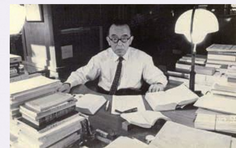
書斎内の信太郎

鈴木 信太郎 プロフィール 20世紀前半の日本のフランス文学研究黎明期に、ステファヌ・マラルメなどの象徴派の詩人や、ヴィヨンを中心とする中世文学を研究したフランス文学者。また、フランス文学関係の稀覯本蒐集家としても知られている。 ※稀覯本…手に入りにくい珍しい書物