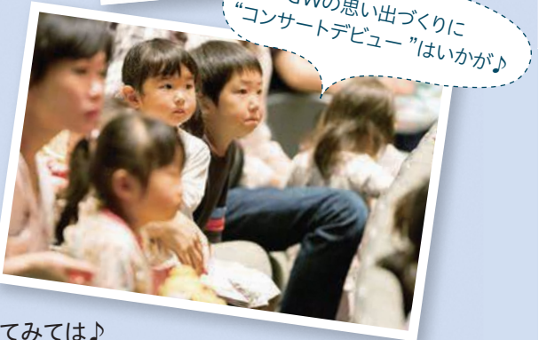
GWの思い出づくりに「コンサートデビュー」はいかが?