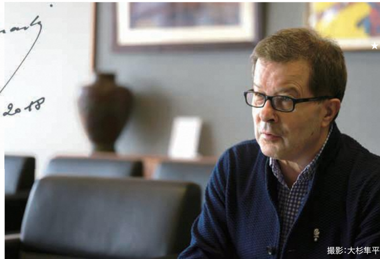
profile フランス・ナント出身。クラシック音楽祭「ラ・フォル・ジュルネ」アーティストック・ディレクター。経営管理学と音楽を学んだのち、1979年に芸術研究制作センター(CREA)を創設。1995年、ナントでLFJを開始。ヨーロッパのクラシック音楽シーンにセンセーションを巻き起こす。

私がかつても大事にしているのは、人と人との関係、そして出会いです。私にとって区長との出会いは大きな幸運でした。文化でまちづくりをするという区長のビジョンと、私たちのビジョンが一致したからこそ、豊島区での開催にたどり着いたのですから。ぜひ豊島区のみなさんに楽しんでいただきたいと思っています。そして、もう一つの会場である丸の内エリア(大手町・丸の内・有楽町)にも足を運んでみてください。2つの会場の聴衆が交じり合うこと、それが私の夢です。