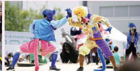
▲フェスティバル/トーキョー17 オープニングプログラム「Toky Toki Saru(トキトキサル)」