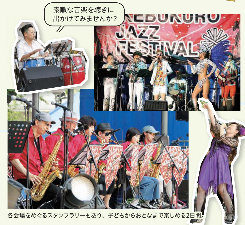
各会場をめぐるスタンブラーもあり、子どもからおとなまで楽しめる2日間。