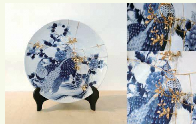
▲2017年IAG大賞「継ぎ芽」/ Buds of KINTSUGI 石川遊雪

優れたアーティストの発掘と、池袋がかつてのようにアーティスト交流の場となることを目的に始まった公募展。来場者の投票によって選ぶ「オーディエンス賞」もあり。