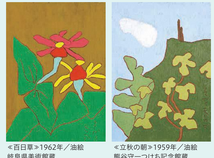
◀百日草▶1962年/油絵 岐阜県美術館蔵 ◀立秋の朝▶1959年/油絵 熊谷守一つけち記念館蔵

毎年恒例の特別企画展。熊谷守一の故郷、岐阜県中津川市付知町の熊谷守一つけち記念館、岐阜県美術館、個人所蔵家に協力いただき、約100点の作品を展示します。 ◇観覧料…一般700円※区内在住、在勤の方は650円(本人確認書類が必要)、高校生・大学生300円、小・中学生100円、小学生未満無料。障害者手帳提示で100円(介助の方1名無料)。