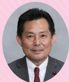
豊島区議会 議長 磯 一昭