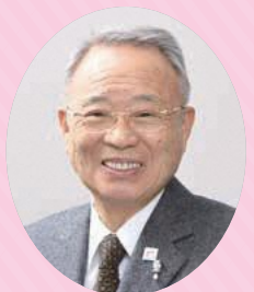
豊島区 長 高野之夫