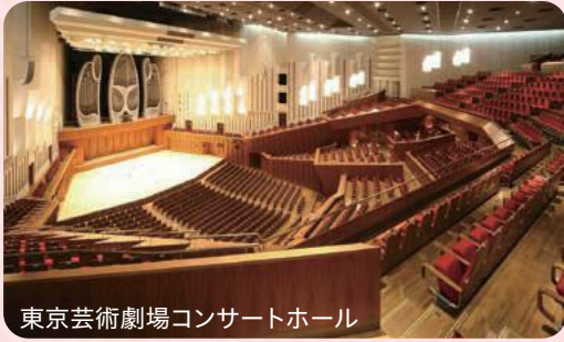
東京芸術劇場コンサートホール

開幕式典を皮切りに始まる「東アジア文化都市2019豊島」。式典は区だけではなく、西安 シーアン 市(中国)と仁川 インチョン 広域市(韓国)から招聘した芸能団による公演が披露されます。