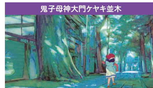
鬼子母神大門ケヤキ並木