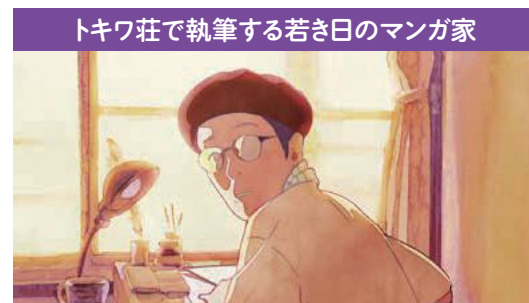
トキワ荘で執筆する若き日のマンガ家