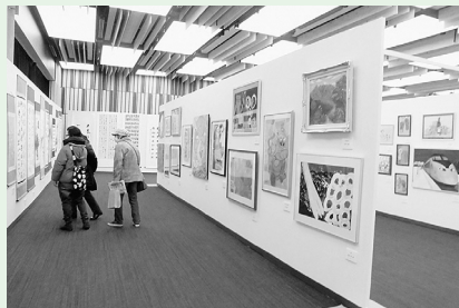
▲2019パラアートTOKYO(2月開催)の様子