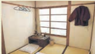
▲マンガ家なりきり撮影部屋

「漫画少年」は、トキワ荘ゆかりのマンガ家がこぞって投稿した日本マンガの母体となるマンガ雑誌です。開館記念展ではトキワ荘との関わりや、子どもたちに夢や希望を与え、偉大なマンガ家たちを輩出した功績について展示します。また、現存する数が少ない貴重な雑誌の現物も100点以上を公開します。ぜひご覧ください!