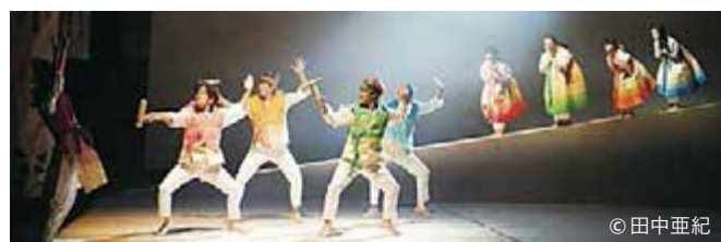
子どもに見せたい舞台vol.13「春～ボムボム～」舞台写真