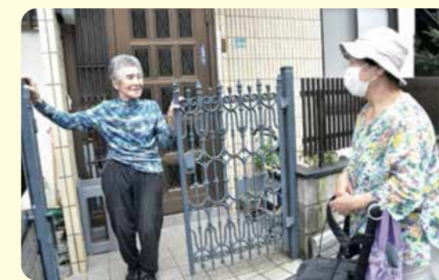
活動について 高齢者クラブのみなさんにお話を聞いてみました！