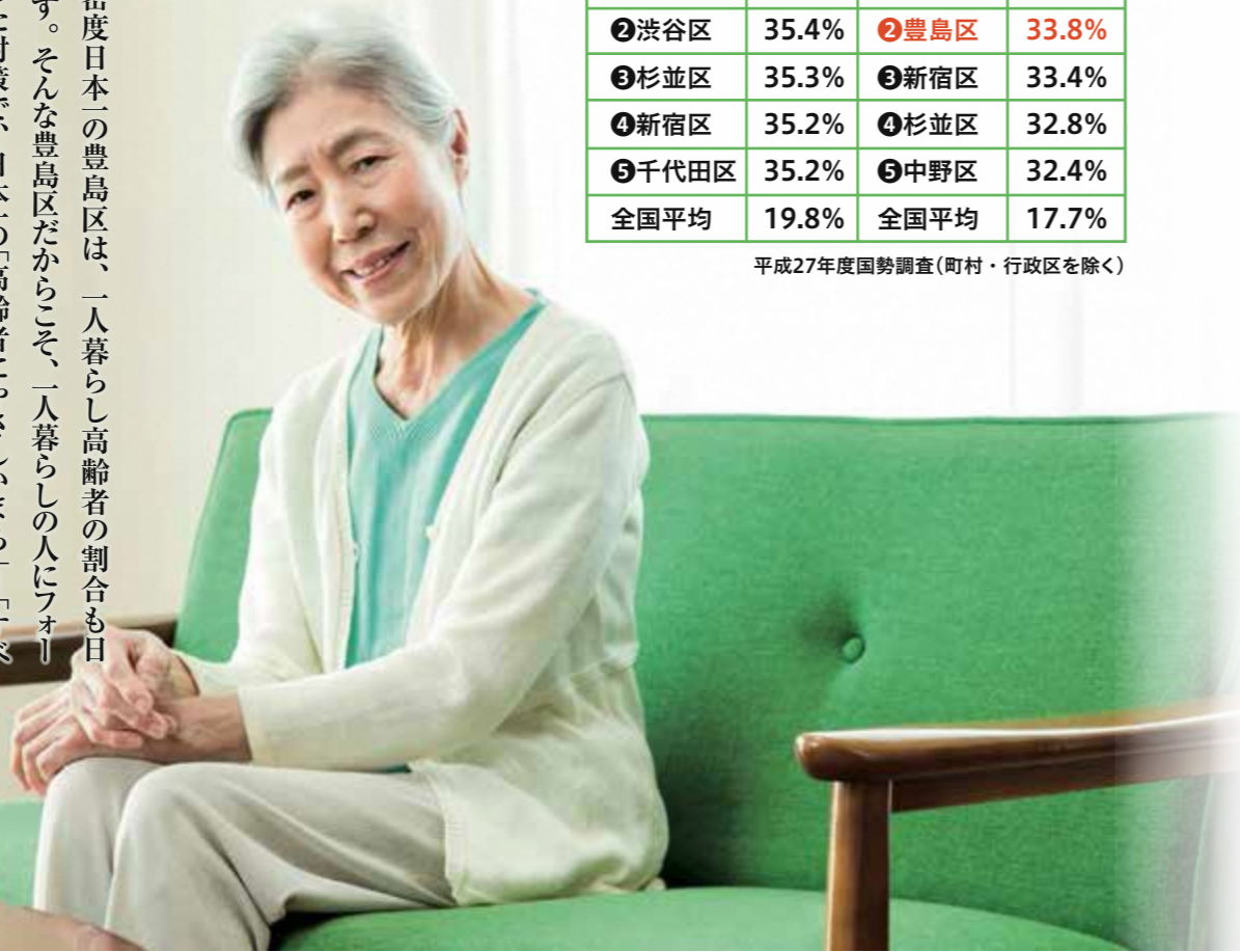
高齢者人口に占める一人暮らしの割合 全国ランキング