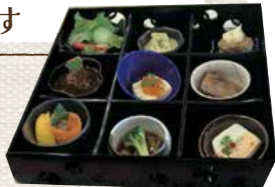
▲食べきり協力店「座・ガモールクラシック鴨台食堂」の「食べきり9種のひとくちランチ」