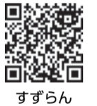
すずらんスマイルプロジェクト